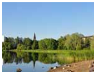
▲ため息が出るほど美しい森と湖