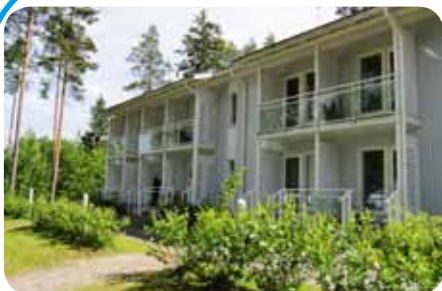
▲障害者、高齢者、失業者も最低保障年金で一定の暮らしが保障され、必要に応じて住宅加算などがあります。