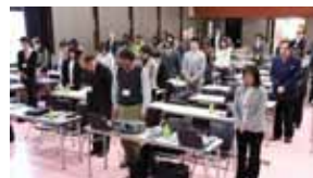
徳島では東日本震災発生時刻にあわせて黙祷

第19回研究大会は2013年3月2日3日鹿児島県鹿児島市、第20回は2013年11月9日10日に東京都（ファイザー株式会社オーバルホール）、第21回は2014年3月8日9日に京都府（ルビノ堀川）にて開催予定です。（新井 宏 記）