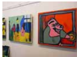
▲絵画や彫刻、織物などがどの部屋にも飾られている