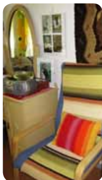
▼サービス付き住宅の食堂は地域の人が自由に利用できる。私達もランチで利用。