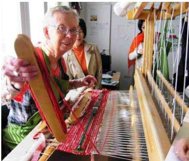
▲色鮮やかな織物を織る女性。他に手芸、料理、ベーカリー、清掃の訓練、手作業の下請けなどグループごとに活動