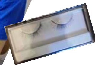
▲袋詰め作業中の男性。詰めているのは「つけまつげ」。どこで販売されるのかな・・・。