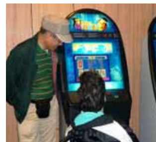
▲ゲームの収益を福祉に

ボードゲームやスロットマシンの収益金が「スロットマシン協会」を通じて福祉関係のNPO等の活動助成に充てられています。施設用地の購入など、大きな資金が動いています