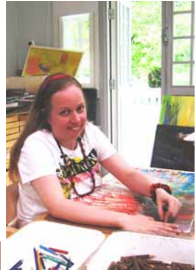
▲とても楽しそうに絵を描いていた生徒さん。