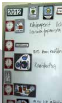
▲1日のスケジュールは絵でわかりやすく表示